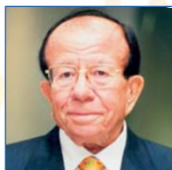
Pedro Brescia Cafferata Presidente