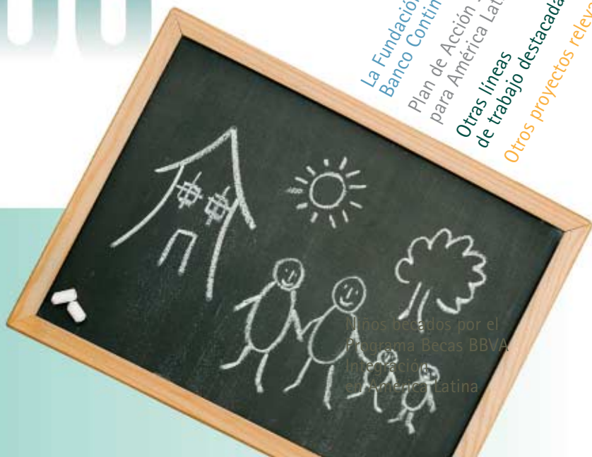
Niños becados por el Programa Becas BBVA Integración en América Latina

En BBVA Banco Continental estamos comprometidos con el desarrollo de las sociedades donde estamos presentes.